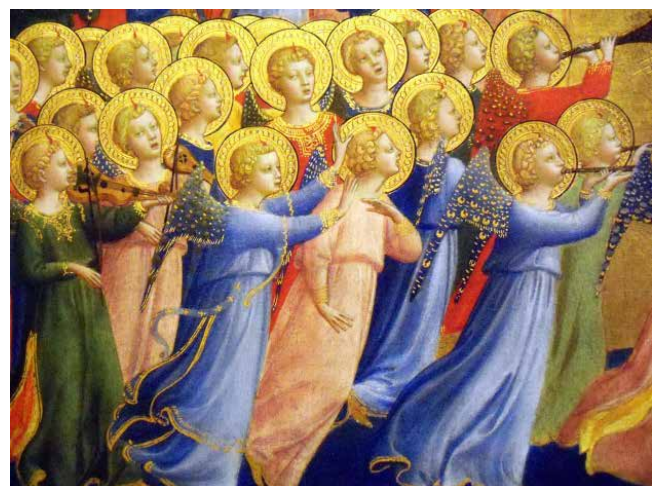
Musizierende Engel, Fra Angelico (ca. 1423)