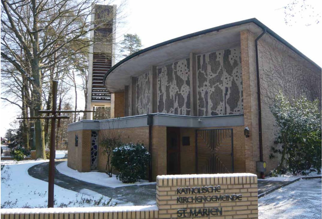
Maria Königin, Bad Schwartau