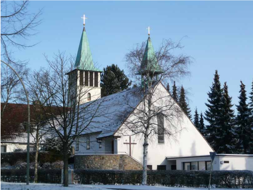
Pfarrkirche St. Bruder Konrad, Hamburg-Osdorf