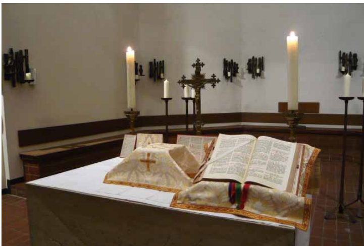
St. Joseph, Hamburg-Wandsbeck