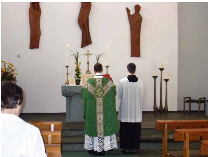
St. Bonifatius, Kiel-Kronshagen

Zwischenzeitlich ist der Wunsch nach der Alten Messe im Erzbistum Hamburg deutlich gestiegen. Auffallend ist, daß sich besonders junge Menschen von der Schönheit und der Spiritualität der traditionsreichen Meßform angesprochen fühlen. Die Gläubigen machen von ihrem guten Recht Gebrauch und freuen sich über die segensreiche Entwicklung in ihrem Erzbistum.