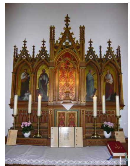
Pfarrk. St. Joseph, Lübeck-Kücknitz